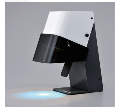
SOLIDILITE V (PN 5105)